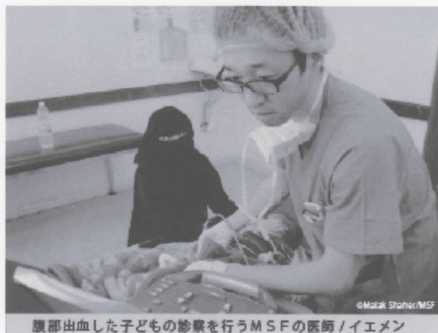
腹部出血した子どもの診察を行うMSFの医師/イエメン