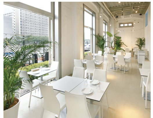
レストラン「キャプテンズワーフ」

Ⓟ タイムズ天王洲公園 品川区東品川2-6 8:00~22:00 20分100円 22:00~8:00 90分100円